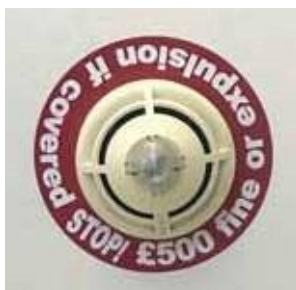
Detector de humo/calor en la habitación

Proporcionamos dichos aparatos para su seguridad, si interfiere deliberadamente con éstos cometerá un delito penal y esto conllevará un procedimiento disciplinario formal.